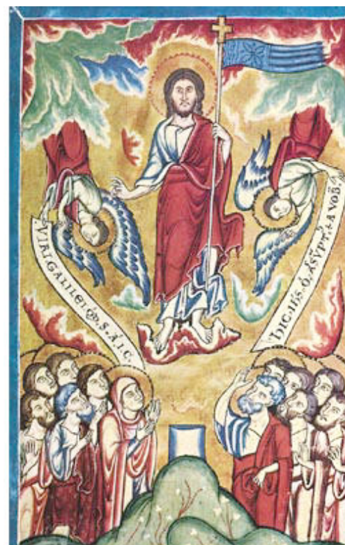
(Brandenburger Evangeliar: 1. Hälfte des 13. Jh.)

Es gibt keine Gott-freie Zone auf Erden, in jedem Gottesdienst können wir die Rückkehr des Himmels in unsere kärgliche Menschenwelt feiern und, dass uns der Himmel auf den Leib rückt und wir ihn sogar in Empfang nehmen dürfen und in uns tragen. Christus bleibt nicht „außen vor“, hält sich nicht raus, betrachtet die Welt nicht amüsiert oder gleichgültig aus der sicheren Perspektive des unzugänglichen Himmels, sondern bleibt uns auf der Spur, will auch fortan unter uns wohnen. Seine Präsenz erdrückt uns nicht. Er macht sich verschwindend klein. Christi Himmelfahrt, der schöne Nachhall von Ostern, erinnert mich sanft daran, wie nahe mir der Himmel ist.